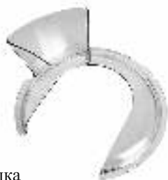
Крышка с воронкой